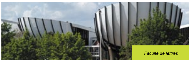
Faculté de lettres

« Puisqu'on a déjà des infrastructures universitaires, on a cette possibilité, puisqu'on a une population de jeunes qui peut être très ciblée, avec ces installations universitaires... et bien, pourquoi ne pas attaquer sur ce fondement là et sur cette base là, de créer peut-être un pôle d'attraction par rapport à la jeunesse... ».