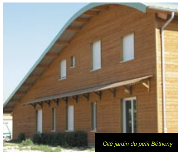
Cité jardin du petit Bétheny

Deux quartiers ont une image très positive. Les cités jardins, quartiers paisibles, possèdent une véritable identité rémoise et font partie intégrante de l'histoire de Reims. Le quartier Clairmarais, situé derrière la gare TGV Reims Centre, est perçu très positivement grâce à sa proximité avec le quartier d'affaires. Cette juxtaposition lui permet de bénéficier de l'image positive, du caractère original, moderne et esthétique de l'architecture de bureaux.