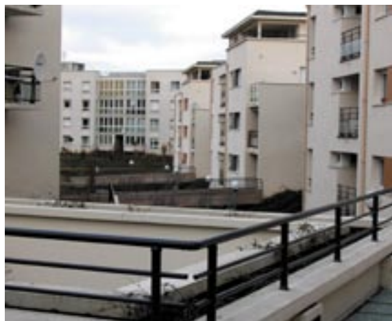
Logements dans le quartier Wilson

Un travail de cohésion, de valorisation urbaine et de l'habitat est, sans conteste, de nature à favoriser la sociabilité du quartier par le plaisir d'y habiter, de conforter et de véhiculer une image positive et de tisser corrélativement des liens avec ce quartier en faisant un lieu d'appartenance.