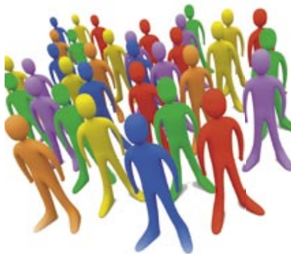
Conseil de quartier

Si la ville peut revêtir un caractère parfois gris et trop minéral, la matière grise des rémois n'a pas fait défaut et l'intelligence citoyenne a été au rendez-vous de ces animations, exprimant une vision ambitieuse du sage et du beau.